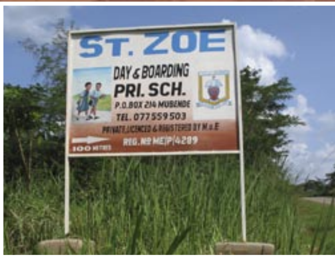
Die Tafel am Strassenrand weist den Weg zu unserer Schule