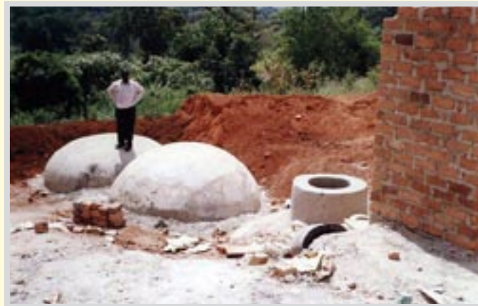
Die Biogasbehälter haben wir in die Erde eingegraben. Rechts davon steht die Toilette.