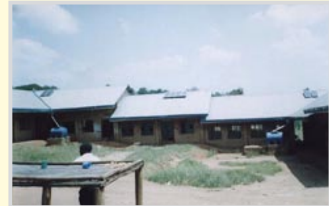
Die Dächer der Schule haben wir mit Solar Panels ausgestattet.

Im Jahr 2007 haben wir ein kleines Solarsystem errichtet, das uns Licht für abendliche Aktivitäten liefert. Die Photovoltaiktechnologie muss komplett nach Uganda importiert werden, deshalb ist sie bis zu dreimal so teuer wie in Deutschland. Wir haben mit einer kleinen Anlage angefangen, die ungefähr 1 Kilowatt Strom pro Stunde liefert. Das Projekt kostete 31.855.952 Ugandische Schilling, das sind in etwa 13.500 Euro.