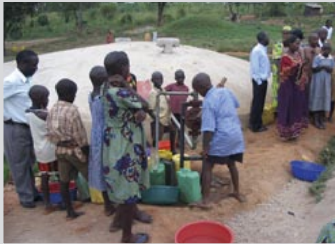
Wasserpumpen an der Zisterne - unser früheres Bauvorhaben - macht den Kindern Spaß

Wir hatten dieses Jahr 288 Kinder an unserer Schule, davon 208 im Internat und 80 als Auswärtige. Insgesamt sind es 138 Mädchen und 150 Jungen. 32 davon haben im November an den nationalen Abschlussprüfungen der Primary School teilgenommen. 25 Mitarbeiter (inklusive Lehrer) kümmern sich um die Kinder. 37 Kindern wird der Schulbesuch von verschiedenen Wohltätern finanziert. 11 Kinder werden von Türkenfeld aus unterstützt, 20 von Manchester, 6 aus Kampala.