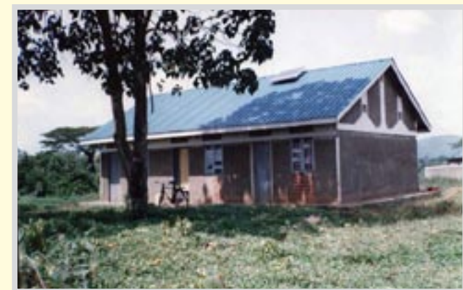
Auch die Lehrerwohnung und weitere Gebäude wurden mit Solar Panels versehen.